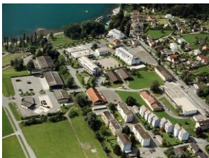
Modul Walenstadt St. Luzisteig