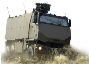
GMTF (Geschütztes Mannschaftstransportfahrzeug)