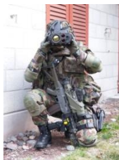
IMESS (Integriertes Modulares Einsatzsystem CH-Soldat)