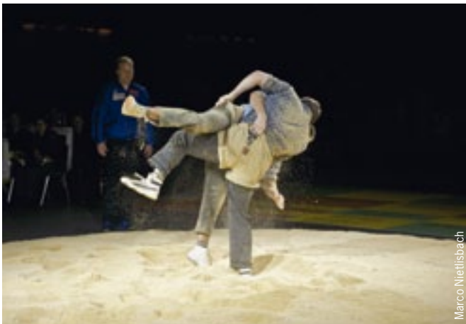
Schwinger im Sägemehl.