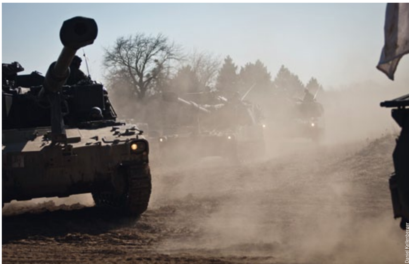
Rund 175 Fahrzeuge standen der Art Abt 10 zur Verfügung.