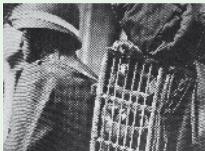
Ein Brieftaubensoldat im Aktivdienst.

Jahre) bestehen. Mit 15'717 Mann ist sie nur noch halb so gross wie ihre Vorgängerin, wobei auf die Zwischenstufe der Brigade verzichtet wird. Nach dem Überfall Nazi-Deutschlands auf Polen erfolgt am 2. September 1939 die Mobilmachung. Die 5. Division bezieht ihre Neutralitätsaufstellung Nordfront I im Raum Brugg-Bözberg und erreicht die Abwehrbereitschaft im März 1940. Nach dem Rütli-rapport sichert die «Fünfte» den Réduit-Ausbau an der Nordfront, anschliessend leisten Teile der Division Ablösungsdienste im Réduit. Gegen Ende des Krieges wird die Division für die Grenzsicherung im Raum Basel aufgegeben –