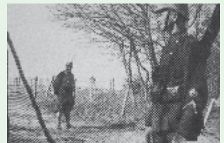
Im Angesicht des Franzosen: Ein Wachtmeister der Füs Kp II/60 auf Grenzpatrouille.

Durch die Neueinteilung werden die solothurnischen Bataillone von der 4. Division ausgegliedert.