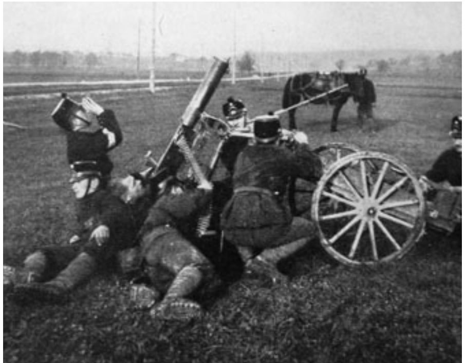
Auf der Jagd nach dem Neutralitätsverletzer.

Quellen: Bataillon 99, 1915 – 1935: Ein Soldatenbuch. Die Fünfte: 111 Jahre 5. Division.