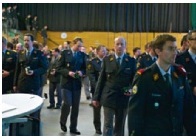
Gäste des Brigaderapports.