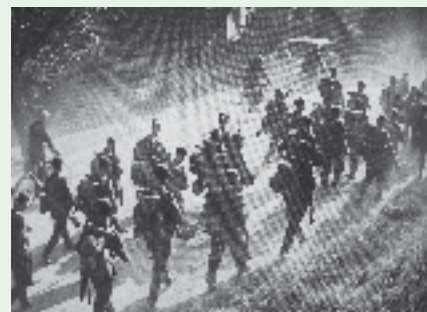
Der Marsch an die Nordfront.

In den Jahren nach 1930 verändert sich in der Schweiz die Einstellung gegenüber der Landesverteidigung. Die internationale Lage mit gescheiterten Abrüstungsverhandlungen sowie der Militarisierung Deutschlands trägt dazu bei, dass ab 1934 von Volk und Ständen Millionenkredite für die Armee sowie Dienstverlängerungsvorlagen gutgeheissen werden. Im Rahmen der Truppenordnung 1938 wird die 4. wieder zur 5. Division. Diese soll beweglicher werden und primär aus besonders leistungsfähigen Auszögern (20–32