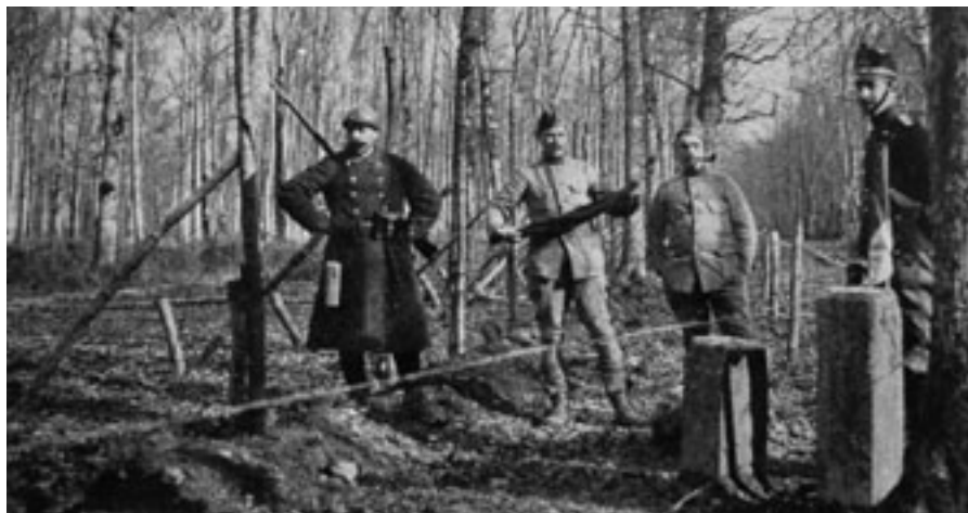
Französische Grenzwache bei Beurnevésin.

telbar vor unserm Grenzabschnitte beobachtete man deutsche Patrouillen. Zweimal entstanden Konflikte, die aber keine diplomatischen Verwicklungen zur Folge hatten. Das eine Mal beschwerte sich die deutsche Grenzwache, dass der Balken über eine Brücke der Lützel, den unsere Posten angebracht hatten, sich auf deutschem Boden befände. Einen andern Charakter hatte ein weiterer Zwischenfall: Einige deutsche Soldaten ödeten unseren Posten an, der sich das nicht ohne weiteres gefallen lassen wollte und deshalb die Gewehre schussbereit machte, worauf die Deutschen ihre Revolver hervorzogen. Glücklicherweise blieb es bei der gegenseitigen Bedrohung. Die Deutschen riefen einige Schimpfwörter über die Grenze und entfernten sich, womit dieser deutsch-schweizerische Konflikt sein friedliches Ende gefunden hatte.»