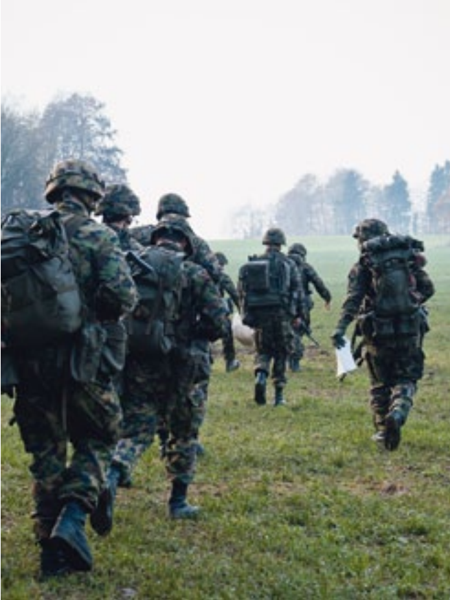
Auch Marschieren gehört zum Alltag eines AdA.