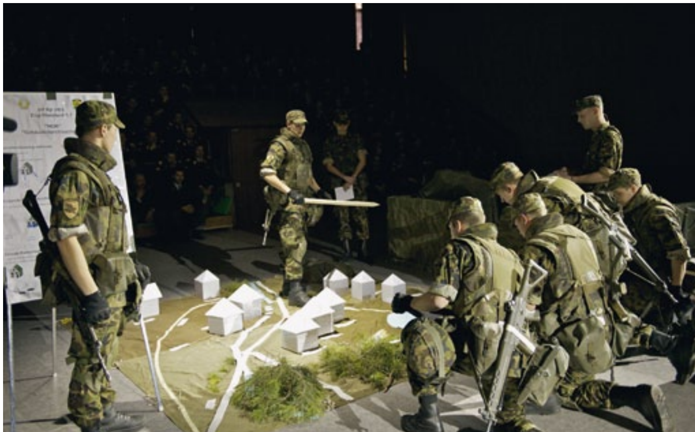
Einsatz im Miniaturformat: Showeinlage am Jahresrapport.