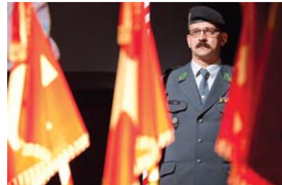
10 Brigaderapport 2011 Mehr als 400 Offiziere der Panzerbrigade 1 trafen in Morges ein.