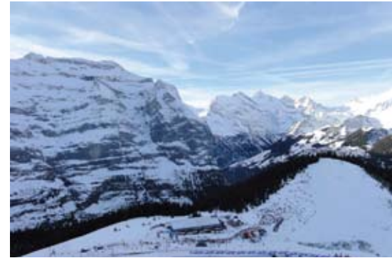
4 Auf den Pisten des Lauberhorns Die Kompanie 1 des Inf Bat 16 in Wengen