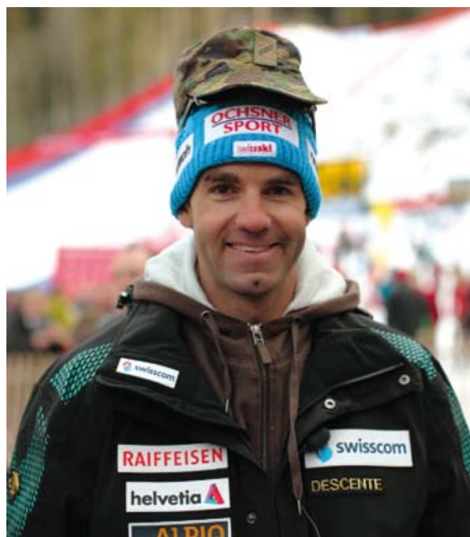
Didier Défago, Ausnahmeskifahrer und Gefreiter in der Schweizer Armee.

Sie haben wirklich eine grossartige Arbeit geleistet. Ich fände es sehr schade, wenn man der Armee solche Mandate wegziehen würde. Ich habe letztes Jahr bei der Patrouille des Glaciers mitgemacht, und auch dort habe ich eine Klasse Organisation der Schweizer Armee gesehen. Danke, Jungs! ■