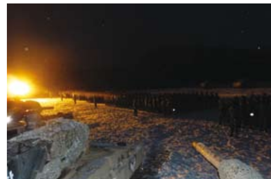
15 Fotowettbewerb Ergebnisse in Bilder