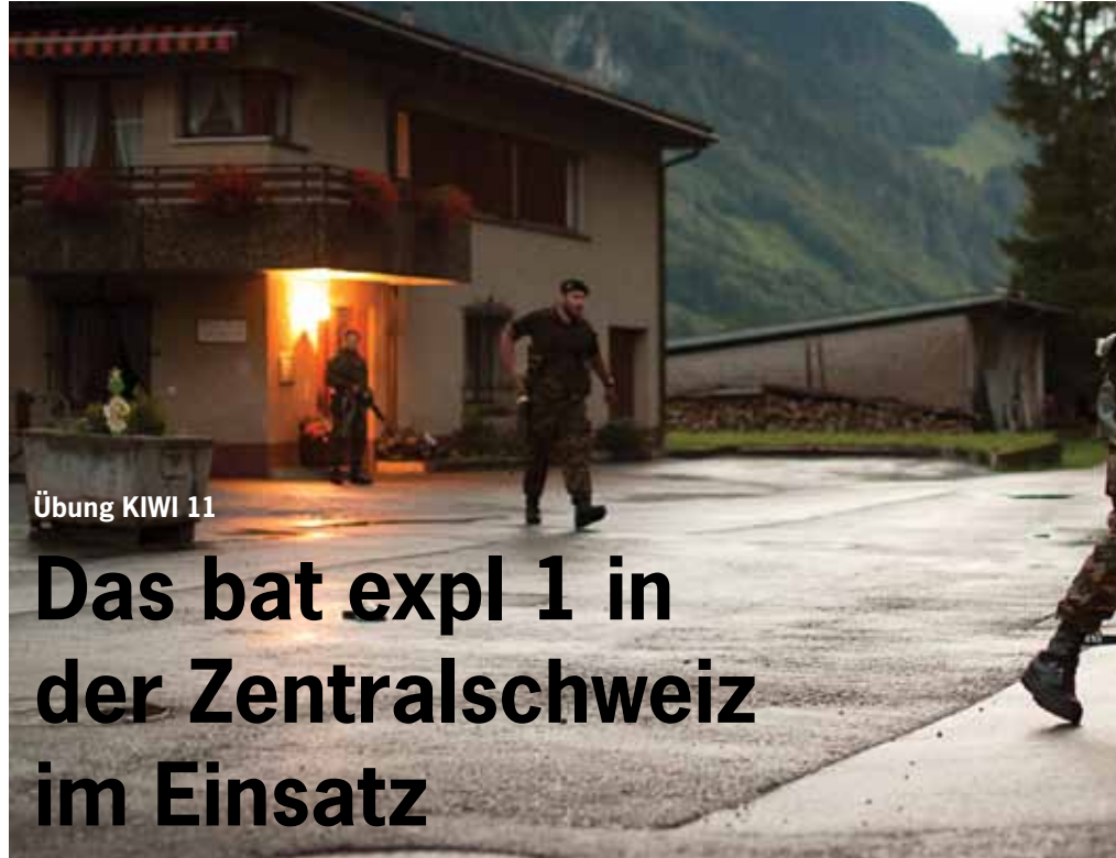
Übung KIWI 11