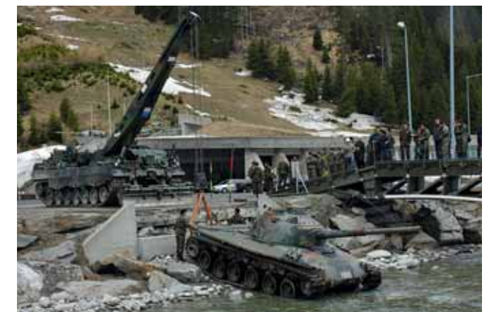
Bergepanzer Büffel in Aktion.