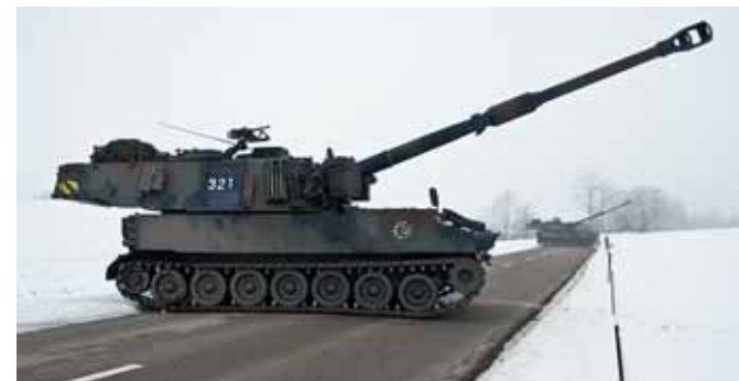
Die Panzer-Haubitzen werden gemäss Befehl positioniert...