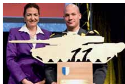
Die Power Awards wurden den Gewinnern von den Kantonen überreicht.