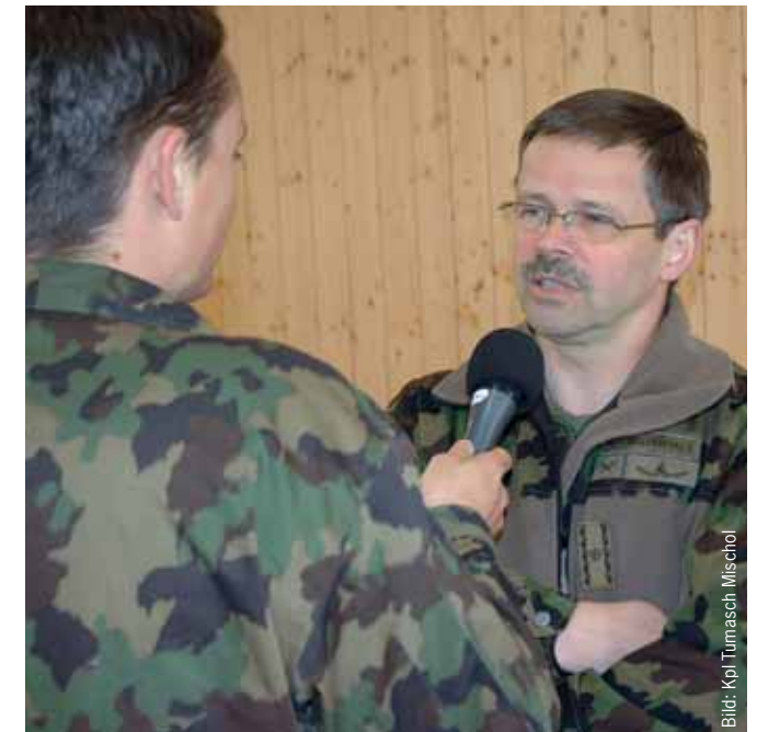
Mit dem Mikrofon im Einsatz: In Hinterrhein entsteht eine neue Reportage aus einem Wiederholungskurs der Panzerbrigade 11.