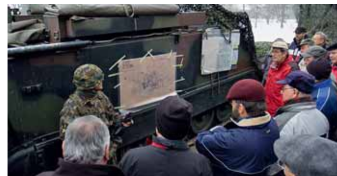
Experten hören mit: Ehemalige Sektionschefs aus dem Kanton Zürich statteten der Art Abt 16 einen Besuch ab.

Und bei dieser Gelegenheit brach der Kommandant auch gleich eine Lanze für den Militärstandort in der Thurgauer Hauptstadt: Frauenfeld sei ein relevanter Militärstandort, in dem Bevölkerung und Ansprechpartner stets ein offenes Ohr für die Bedürfnisse des Militärs hätten. ■