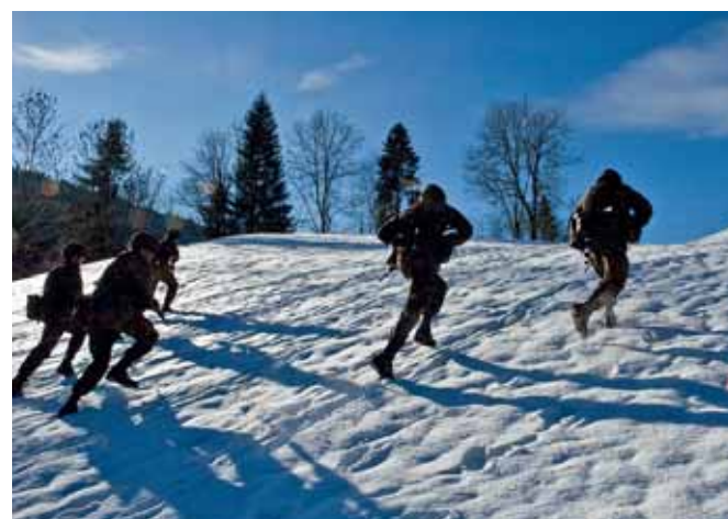
Voller Einsatz trotz eisiger Kälte.