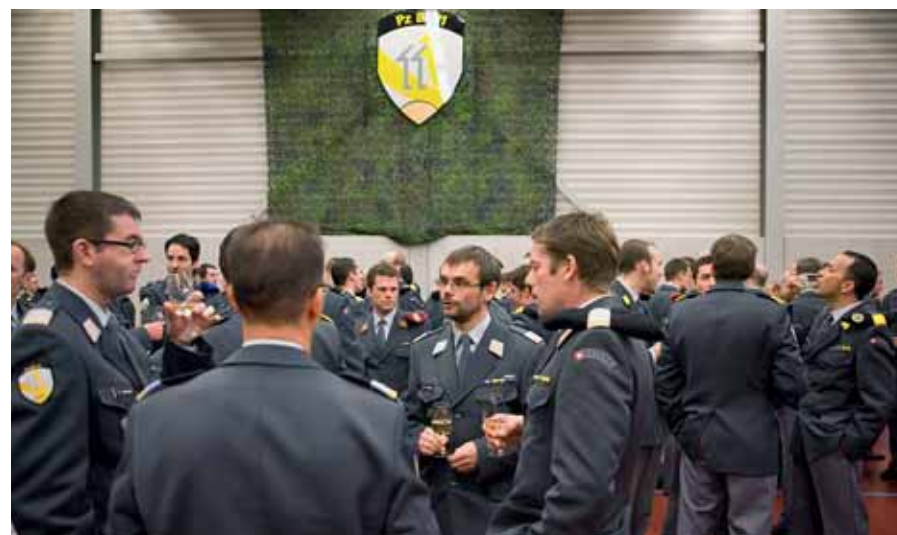
Während dem Apéro wurden Freundschaften und Kontakte gepflegt.