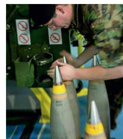
Tempierung der Zünder im Simulator.

Ja, ich bin Hobbyfotograf, mache Sportfotografie und Nachtaufnahmen, und betrachte dies hier als Erweiterung meines Spektrums.