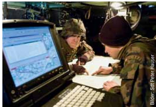
INTAFF im Einsatz: Der Befehl kommt via Computer, die Landkarte hat dennoch nicht ausgedient.

Bei der Übung JUPITER im frostigen Thurgau lag ein Augenmerk auf der Funktionsweise des «Integrierten Artillerie Führungs- und Feuerleitsystems», INTAFF. Das Kommunikations- und Datenbanksystem ermöglicht es den Truppen, über Computer schnell Daten auszutauschen. Kommuniziert werden kann über eine Distanz von rund 20 Kilometern. Die Truppen nutzen die neuen technischen Möglichkeiten vollumfänglich aus: Hin und wieder sind die transferierten Datenmengen so gross, dass das System nahe an seine Leistungsgrenzen kommt.