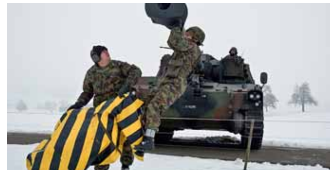
... was durchaus mit einiger Mühe verbunden ist.