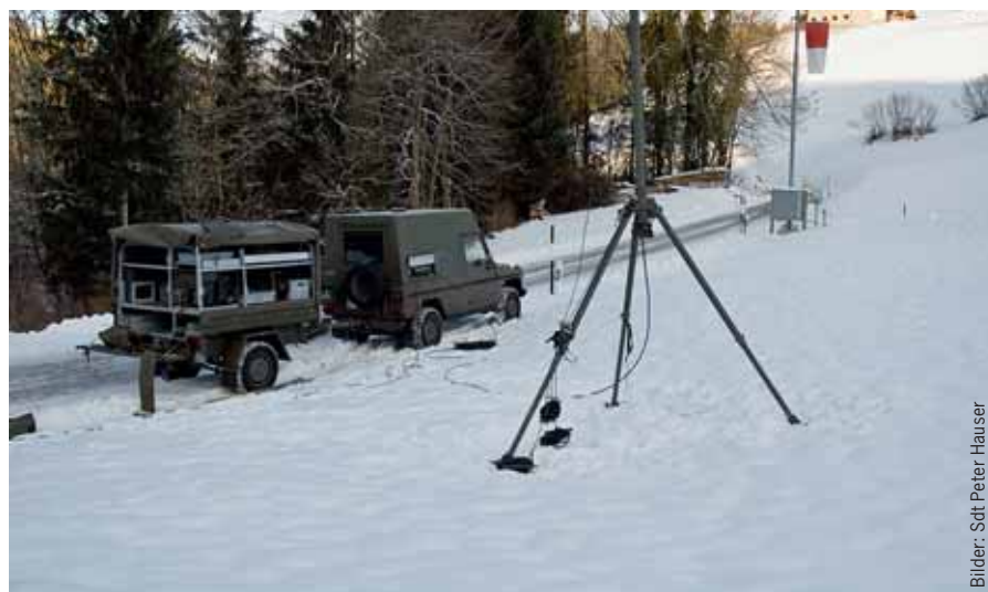
Alles bereit für Übungseinheiten mit dem neuen Funkgerät.

Gut einprägen mussten sich die Mitglieder des FU Bat auch den Umgang mit dem Funk-