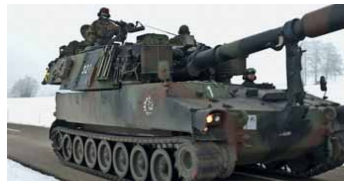
Sind die INTAFF-Befehle ausgewertet, können Weisungen an die motorisierten Einheiten weitergegeben werden.