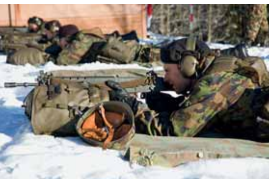
Volle Konzentration und ruhige Hand vor der Schussabgabe.

gerät SE-240. Ein grosser Nutzen des neuen Geräts ist augenscheinlich. Gerade einmal 3,7 Kilo wiegt das SE-240. Kein Vergleich zu den vier Trageeinheiten à 40 Kilo, die bislang transportiert werden mussten. Nach dem «Kennenlernen» des SE-240 kam das Gerät im WK gleich auch bei der Übung «JUPITER» zum Einsatz.