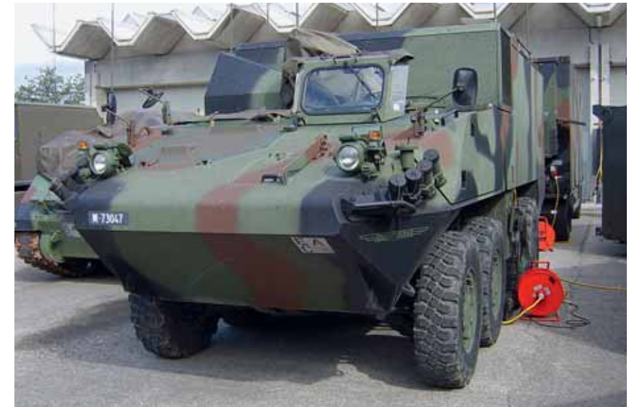
Fahrzeug ausgerüstet mit FIS HE.

Auf diese hervorragenden Leute ist Kellerhals aber auch angewiesen, will er die selbst sehr hoch gesteckten Ziele erreichen. Der komplexe Umbau reicht nämlich einerseits nicht nur bis auf Zugstufe hinunter, sondern verändert in einigen Fällen auch deren innere Struktur: So bestehen Panzerzüge künftig nicht mehr aus drei, sondern aus vier Kampfpanzern. Zum anderen ist der