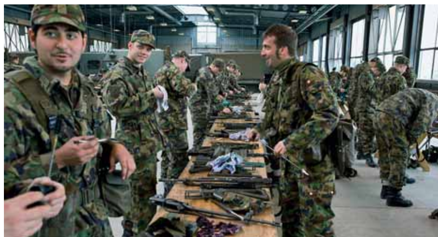
Auch die kleinen Waffen müssen gewartet werden!

Feuerleitbatterie, fügt hinzu: «Es ist einfach extrem, wie viele Junge dieses Jahr dabei sind, ich gehöre mit meinen fast 28 Jahren schon längst zum alten Eisen. Die Mischung aus älteren, erfahrenen Soldaten und Kadern und Jungen, frisch (und gut) ausgebildeten AdA ist enorm wichtig, weil die Älteren wissen, wie der «Laden» in einem WK läuft, die jungen hingegen vor allem hinsichtlich technischer Ausbildung auf dem neusten Stand sind.