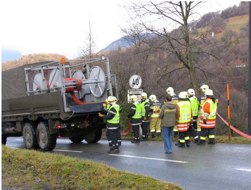
Sapeurs-pompiers et militaires en action