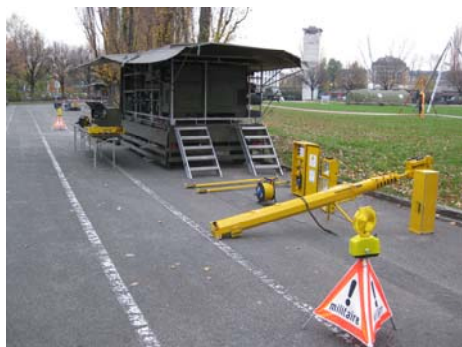
Mat d'éclairage de grande surface de 12 m.

Après une semaine d'exercices et de rafraîchissements des techniques de sauvetage, le week-end tant attendu est enfin arrivé... mais pas pour tous : des soldats et des officiers se sont portés volontaires pour la démonstration "MILPOMP 08". Celle-ci consistait à montrer au public les techniques de sauvetage et le matériel mis à disposition de la troupe. Malgré le froid et l'heure matinale d'ouverture de la journée, les visiteurs se réjouissaient d'assister aux nombreuses démonstrations programmées. Retour en images.