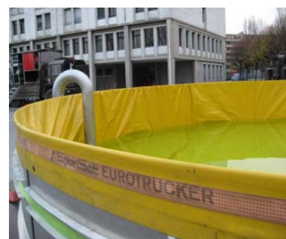
Bassin de 50 m 3