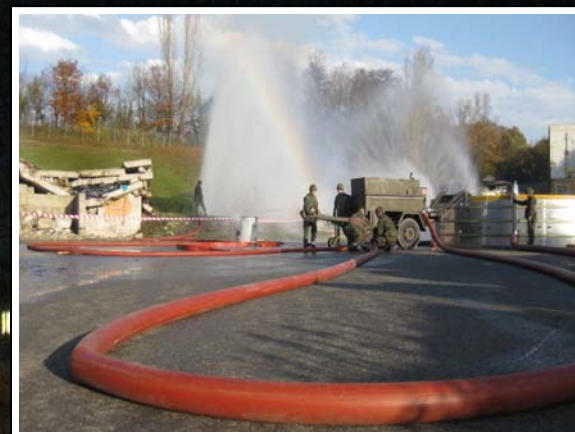
Übung "Ad Unum": Zug vom Lt Tedeschi in Einsatz in Epeisse