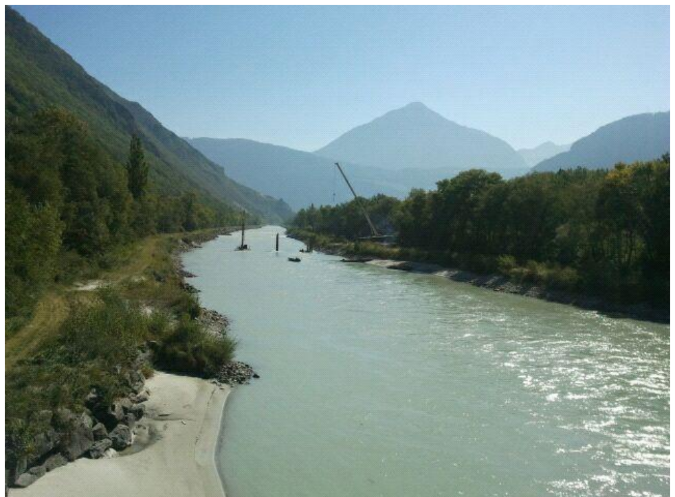
Image: Photo panoramique avec le Rhône

L'accent a été mis sur la sécurité des soldats, comme l'image ci-dessous le montre, il s'agissait d'un grand chantier sur l'eau. Il était primordiale que la sécurité de l'exercice soit assurée, d'autant plus que ce n'était pas un exercice des plus faciles.