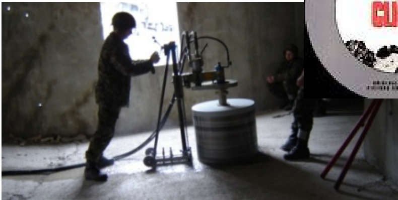
Exercice de manipulation avec la machine hydraulique de carottage de diamètre de 70 cm