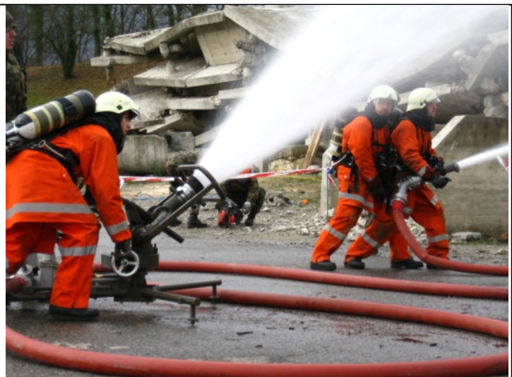
La démo «CERMIMO» a clos la 2e semaine en beauté. Les invités du Cercle Militaire de Morges ont été ravis