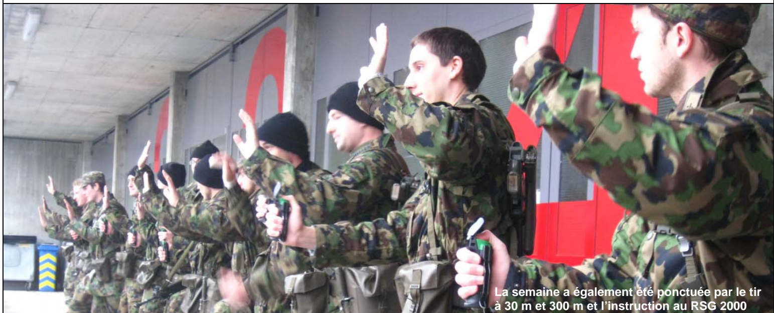
La semaine a également été ponctuée par le tir à 30 m et 300 m et l'instruction au RSG 2000