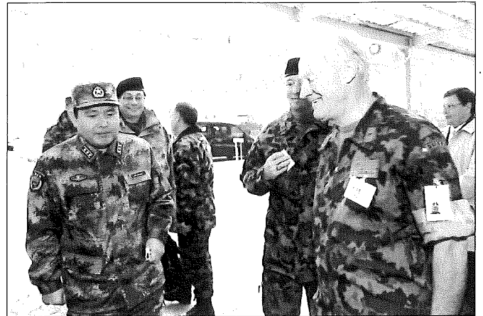
Le colonel Rey reçoit le général de l'armée chinoise Wu Wenge.