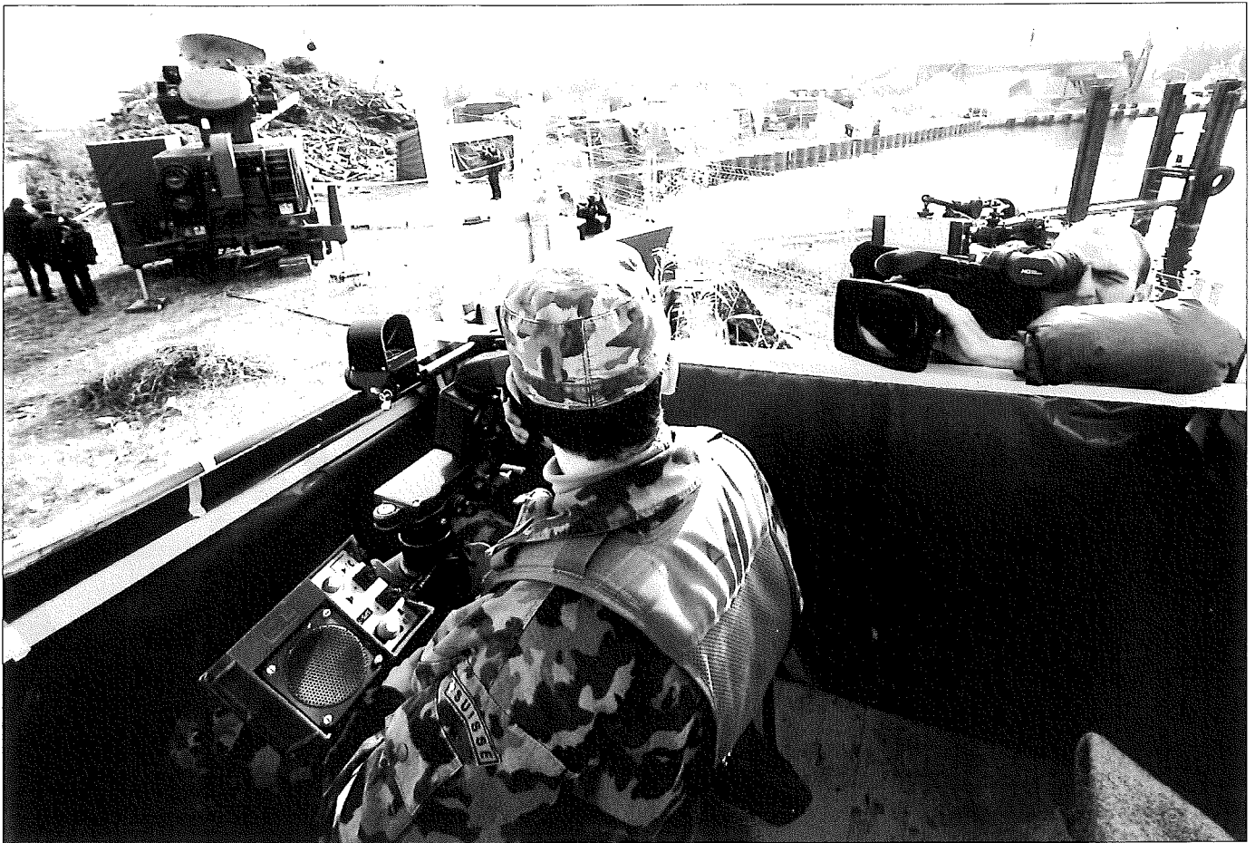
Surveillance de l'espace aérien par un radar Skyguard .

2, de la police cantonale vaudoise et de la PCi a réalisé un important travail de vulgarisation et d'information. En distribuant quotidiennement à 5'500 exemplaires un journal de 8 pages dont deux éditions de 16 pages chacune, français/allemand, intitulé L'Equipier , la cellule communication a pu expliquer à tous les engagés, policiers et civils compris, quelles étaient les missions des autres dans le contexte général. L'objectif était donc tant civil que militaire de pouvoir dire : « A la Francophonie, j'y étais et j'ai su pourquoi ! »