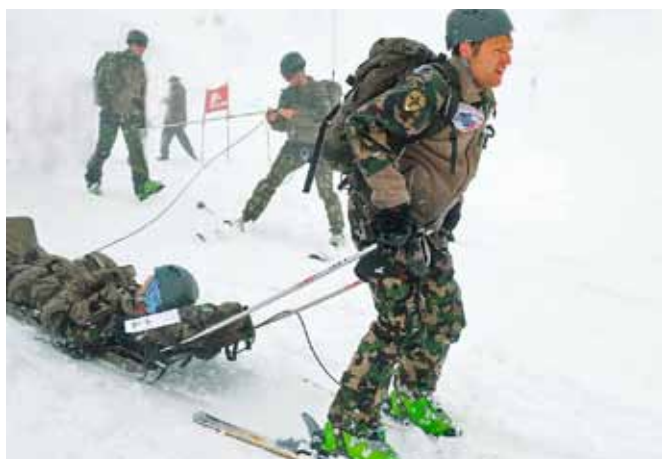
Una (s)comoda slittata.