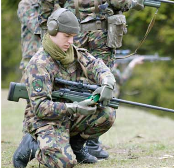
Anche i tiratori scelti sono entrati in scena.