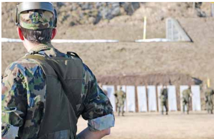
Sulla piazza di tiro di Fontana si esercitava con dedizione il tiro.