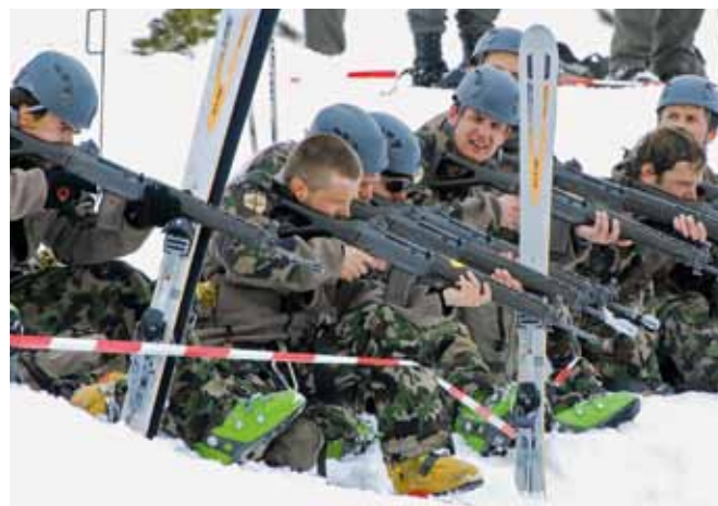
Maledetta gara di tiro: ha fatto saltare la vittoria alla nostra pattuglia.