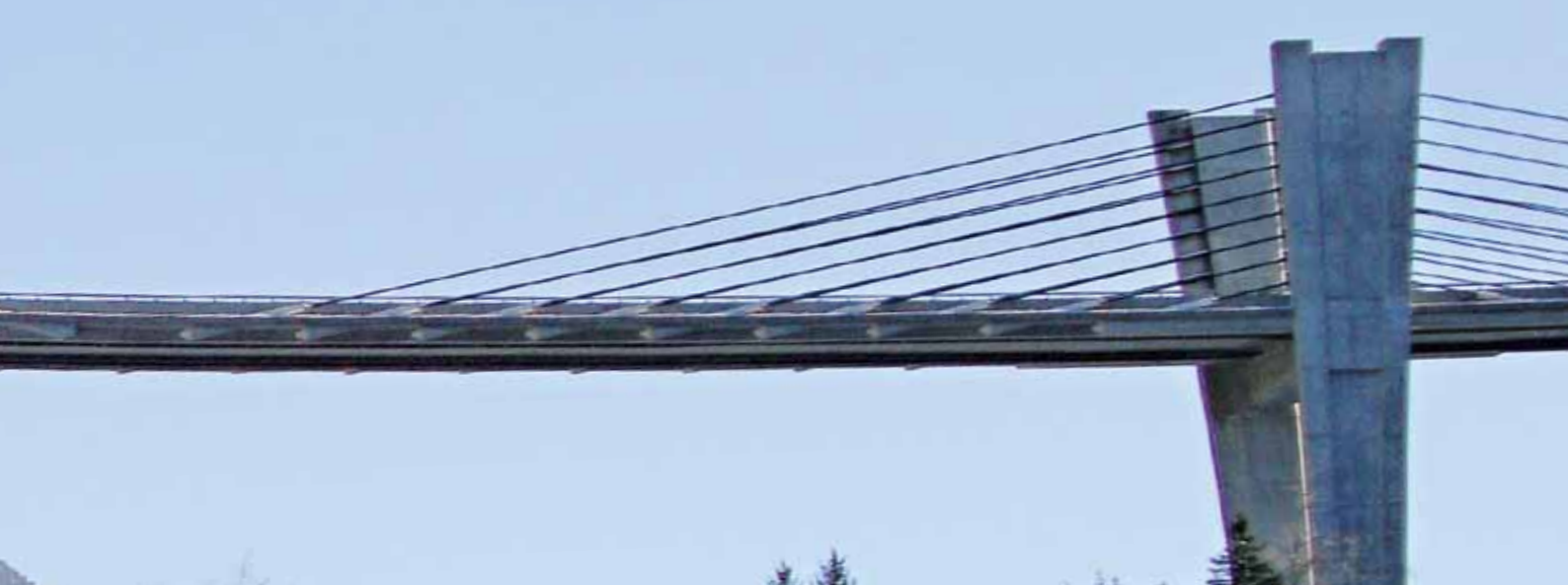
L'imponente ponte del Sunniberg

«Per evitare l'aggravarsi della situazione, vogliamo evitare il contatto diretto con eventuali attivisti», spiega il cdt cp I ten Philip Wepener. In caso di imprevisti, i soldati devono informare immediatamente la polizia cantonale grigionese o la centrale d'intervento militare. Nonostante il rischio di disordini sia aumentato, durante la visita del nostro giornalista la situazione in territorio grigionese è rimasta tranquilla e tale rimase anche nei giorni seguenti. Il bat fant mont 29 non è stato toccato né direttamente né indirettamente; nemmeno dall'esplosione di un