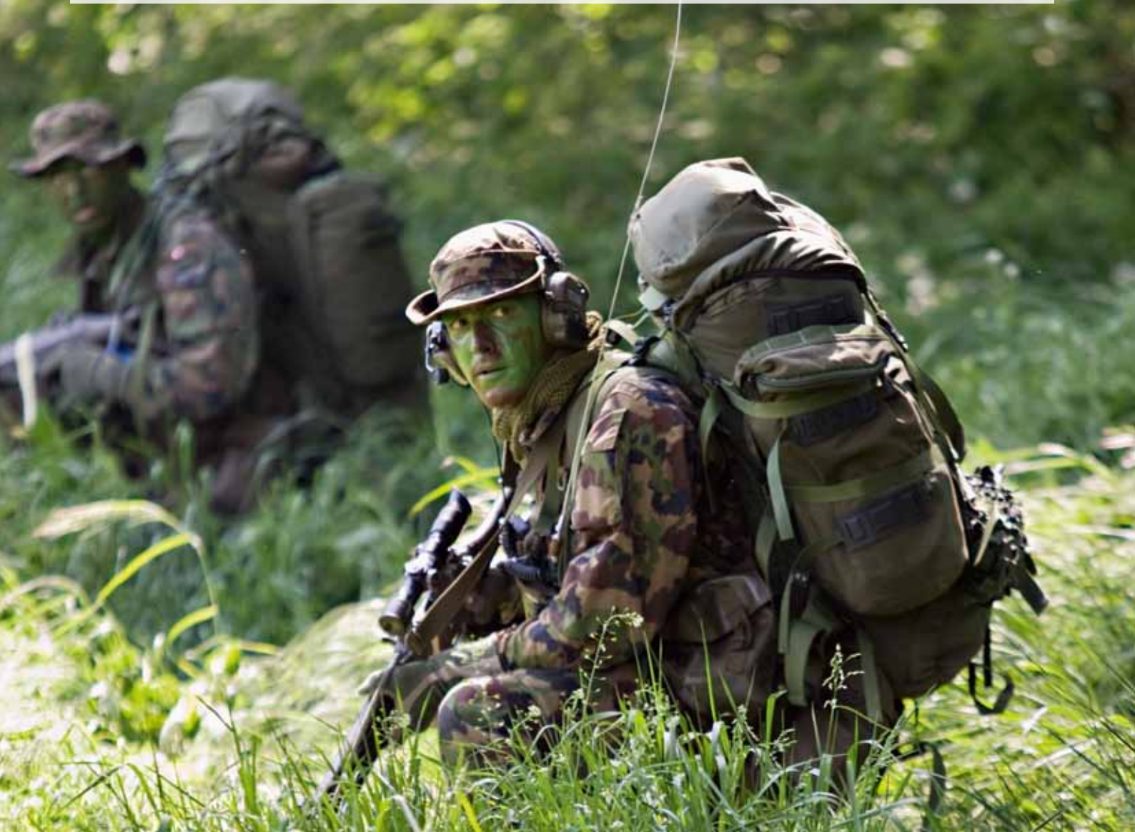
Accovacciati e mimetizzati: i soldati del bat fant mont 7 si impegnano al massimo.

Sorvegliare le ambasciate, sostenere eventi sportivi: questi erano stati gli ultimi corsi di ripetizione del bat fant mont 7. Adesso però i soldati erano felici di avere nuovamente dita doloranti e gambe pesanti.