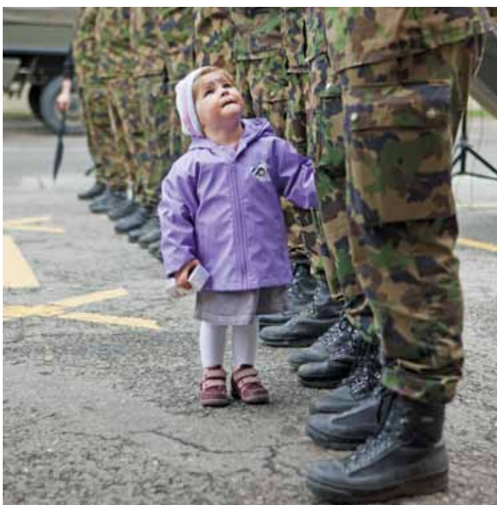
La meraviglia della bambina. La giornata delle porte aperte è stata un grande successo.

bevande fresche, coccolando i visitatori, hanno contribuito al benessere degli ospiti.