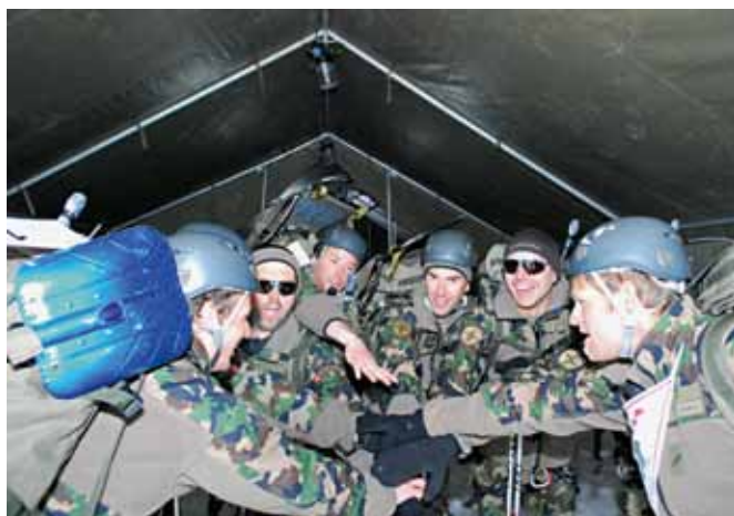
Lo spirito di squadra si fa sentire.

Alla fine dell'ardua competizione, i soldati della br fant mont 9 non avevano dubbi: «Austria, ritorneremo!». Il prossimo Edelweiss Raid si terrà nel 2013. ■