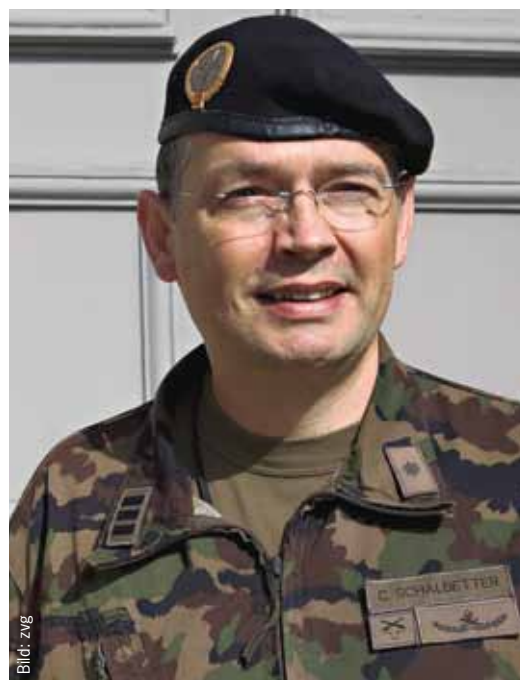
Col SMG Christophe Schalbetter

Schalbetter: L'interazione tra la truppa al fronte e lo stato maggiore si sviluppa in varie occasioni. Da un lato le visite alla truppa del comandante di brigata. Poi ci sono gli esercizi di stato maggiore condotti dal comandante di brigata e da membri scelti dello stato maggiore con le unità subordinate. Da ultimo le visite alla truppa da parte di singoli membri dello stato maggiore a sostegno dei vari ambiti fondamentali di condotta e per tastare il polso della gente. Questo contatto è peraltro fondamentale per garantire il ricambio del personale.