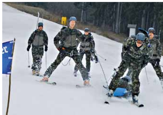
Velocità altissima in alcuni tratti.