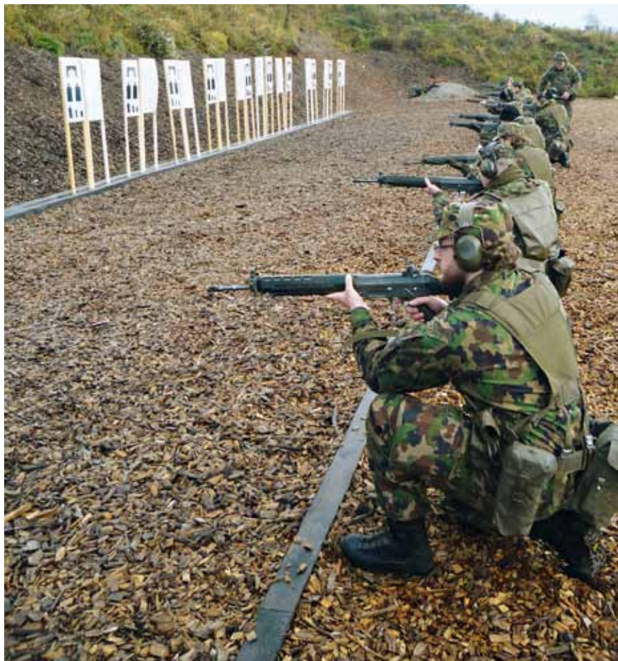
Anche il tiro va allenato: i soldati si esercitano alla postazione di tiro ravvicinato.

Come è stata consuetudine negli anni passati, per la durata di due settimane, tre compagnie e parti dello stato maggiore saranno truppe di prontezza. Si tengono pronte ad appoggiare le autorità civili. Ma non è tutto: l'unico battaglione di fanteria italofono della Svizzera festeggia quest'anno il suo cinquantésimo compleanno. Questo giubileo sarà sottolineato in modo adeguato, fedele al motto del comandante «L'essenziale ma bene!» ■