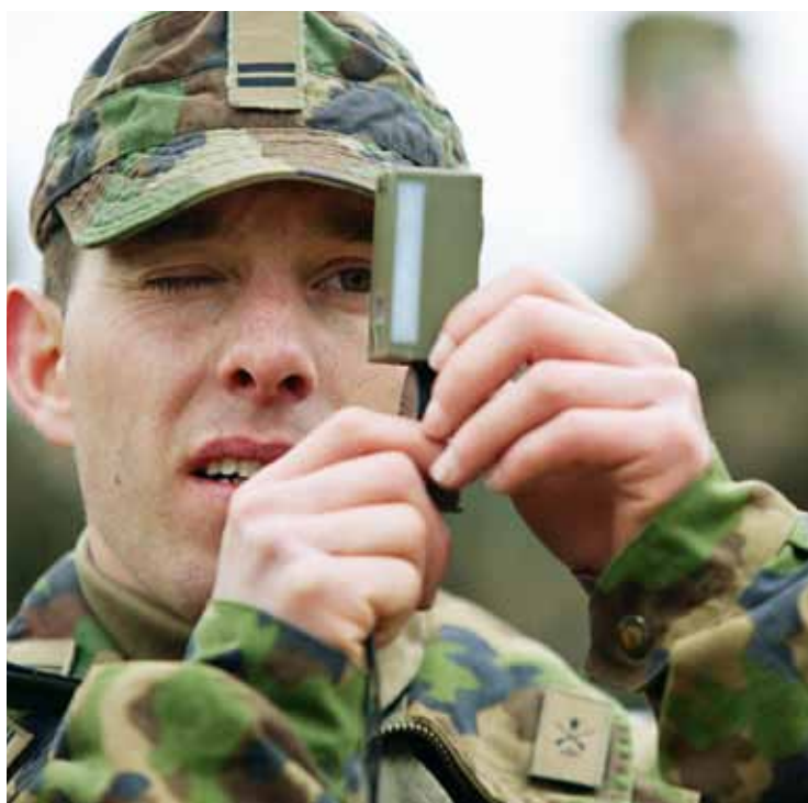
Speriamo che abbiano mirato bene prima di sparare.