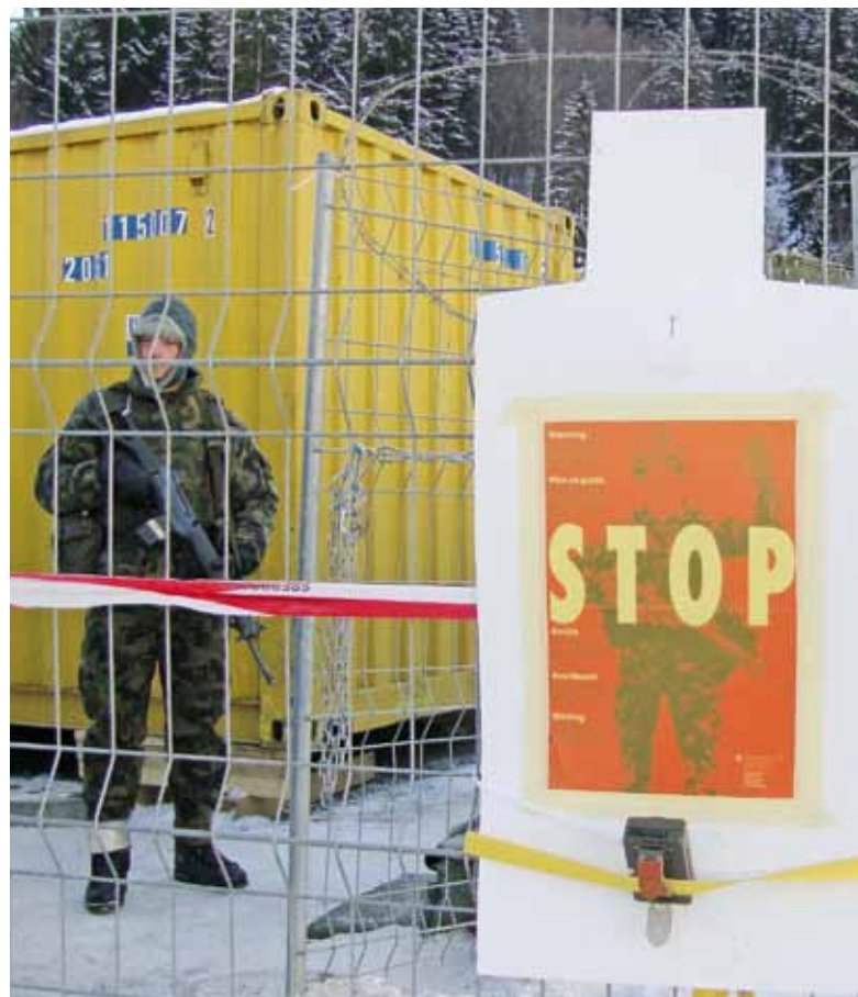
Un soldato di guardia: anche questo fa parte dell'impiego al WEF.