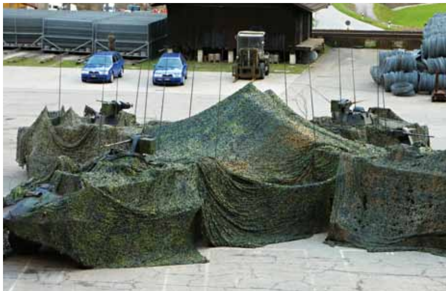
Un buon camuffamento è metà dell'opera.

Infine, come da programma, si giunse all'esercizio MATRO. Il nome si ricollega a una cima nel settore d'impiego sulla quale sono installate varie antenne radio. L'esercizio prevedeva in una prima fase l'entrata in un'infrastruttura di condotta segreta nell'alta Val Leventina. Poi fu ordinato lo spostamento delle infrastrutture di condotta (sistemi radio, posti di lavoro e materiale informatico) nel posto di comando in tempo di pace a Bellinzona. Nel contempo si verificò la capacità di assicurare la condotta mobile dello scaglione di condotta. Durante questo processo, indubbiamente pieno di trabocchetti, sono entrate in gioco molte abbreviazioni tedesche: GEKO, ZUKO, VOKO. Quale neofita di tali esercizi lo scrivente si credeva in uno zoo in Africa. Questi strani nomi non designavano animali, ma si ricollegavano ad aspetti molto concreti, come il controllo dei bagagli (GEpäckesKontrolle), il controllo d'accesso (ZUtrittsKontrolle) e al controllo preliminare (VORkontrolle). Ad ogni modo, il bat aiuto cond 9 riuscì a svolgere un buon esercizio, sebbene afflitto da un'acuta carenza di quadri e materiale. ■