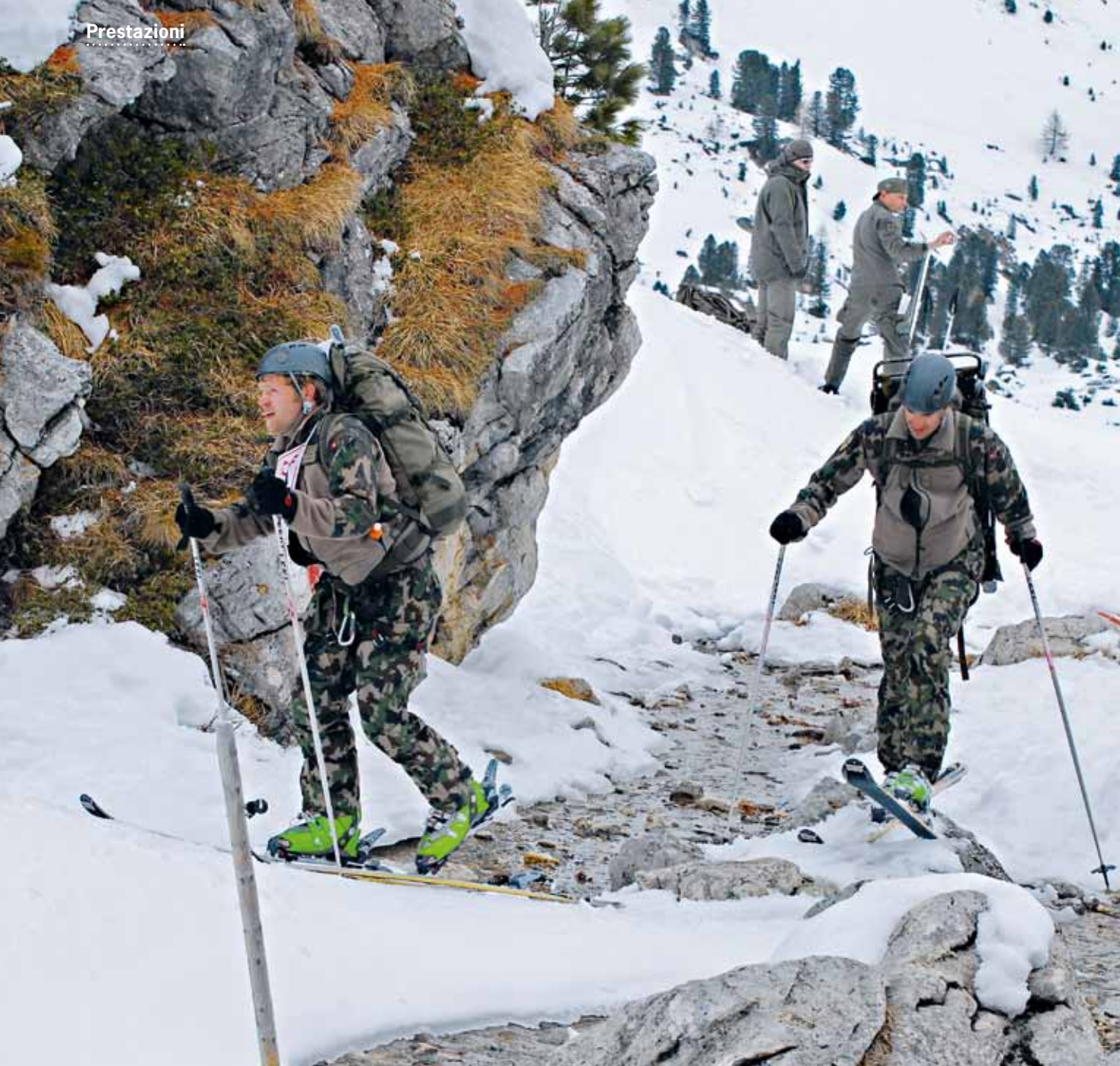
Una salita che fa sudare: la pattuglia della br fant mont 9 ce la mette tutta.