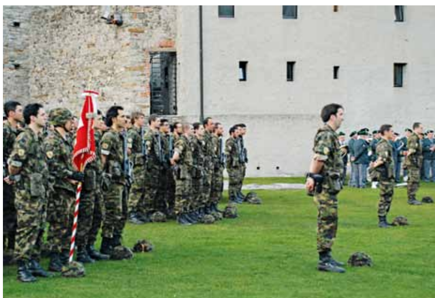
I militi del bat aiuto cond 9 durante la resa dello stendardo a Bellinzona.