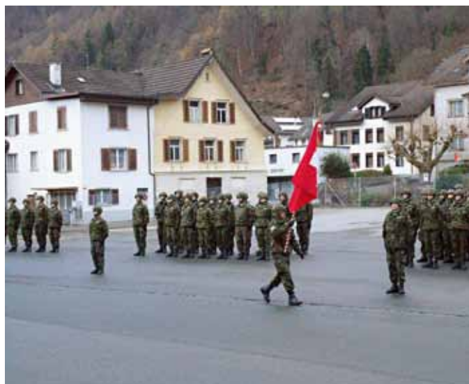
Concentrati, motivati, pronti all'impiego: il bat fant mont 30 durante l'istruzione.