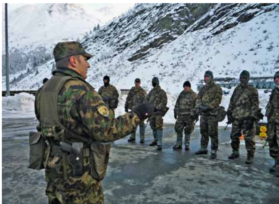
Sebbene faccia freddo, i militi del bat fant mont 30 sono profondamente concentrati.